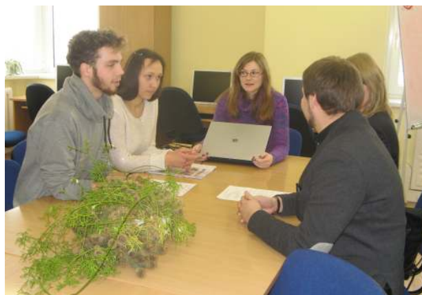
Sutarties pasirašymo akimirka

VPMF „Interjeras“ ir „Siluetas“ informacija