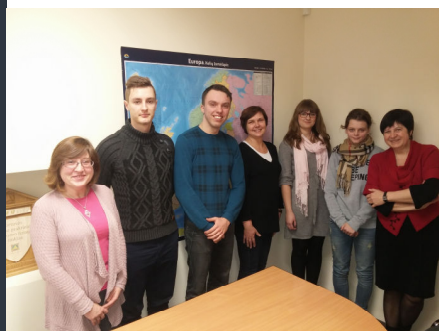
Su VPMF „Reda“ atstovais