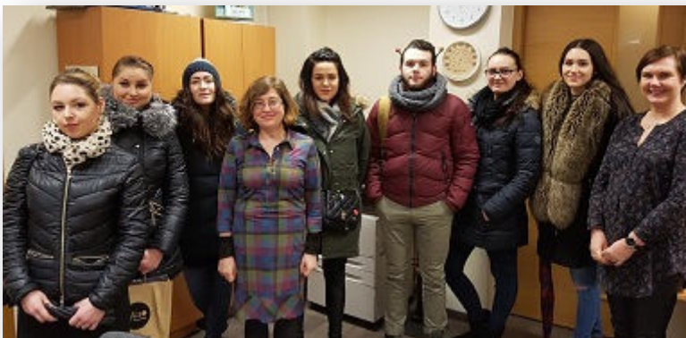
Po vizito „Simulith“ centre

Š.m. vasario 21 d. „Simulith“ centre lankėsi IB „REDA“ praktikantai. Susitikime dalyvavo maitinimo verslo organizavimo ir verslo vadybos specialybių studentai iš Vilniaus kooperacijos kolegijos. Studentai domėjosi Centro veikla, jo padaliniais, artimiau susipažino su Centro darbuotojais. Praktikantai pasidalijo įspūdziais apie darbą verslo praktinio mokymo firmoje, aktyviai klausinėjo apie „Simulith“ centro istoriją, jo bendradarbiavimą su kitais pasaulinio tinklo EURO-PEN-PEN International nariais, pasakojo apie rengimąsi mugei, kuri šiemet vyks Kėdainiuose. Po susitikimo „Simulith“ centre praktikantai išskubėjo į kitą susitikimą su kolegomis į IB „Vilionė“.