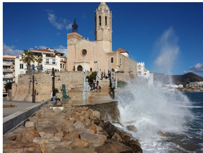
Iglesia de Sant Bartomeu i Santa Tecla, Sitges

Po pietų nagrinėjome finansinius klausimus. Kartu su Lietuvos ir Vokietijos kolegomis vakarą kartu praleidome Sitges mieste, kuriame Ispanijos kolegų rekomenduoti buvome apsistoję.