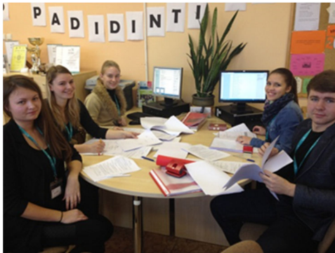
VPMF „Taliija“ darbuotojai

Studentų, studijuojančių turizmo ir viešbučių vadybos (TV) studijų programoje, tikslas - tapti geriausiais savo srities specialistais (vadybininkais, kelionių agentais, gidais) ir siekti kuo geriausių rezultatų darbe. Praktika Verslo praktinio mokymo firmoje (VPMF) tai ne tik verslumo, profesinių, techninių žinių pritaikymas praktikoje, čia studentai dalinasi savo asmenine patirtimi, vyksta bendravimo, bendradarbiavimo bei komandinio darbo įgūdžių lavinimas.