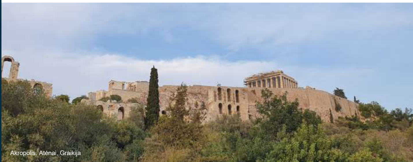
Akropolis. Atėnai, Graikija