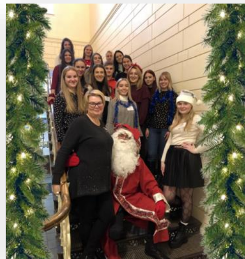
„Turistlandija“ darbuotojai su vadove

Kauno kolegijos IB „Turistlandija“ informacija