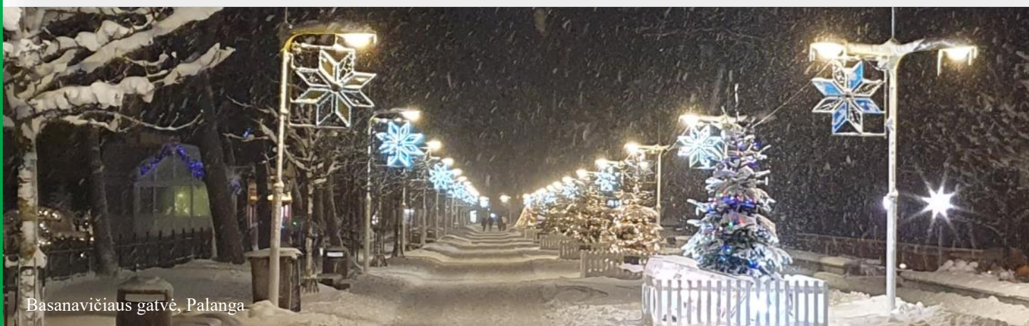
Basanavičiaus gatvė, Palanga

Informuojame, jog šioje puslapio dalyje pateikta informacija yra mokomojo pobūdžio ir skirta mokymo tikslais vykdyti prekybą uždarame Lietuvos imitacinių bendrovių „Simulith“ tinkle. Pateikta informacija nesukuria jokių teisinių santykių ar įsipareigojimų.